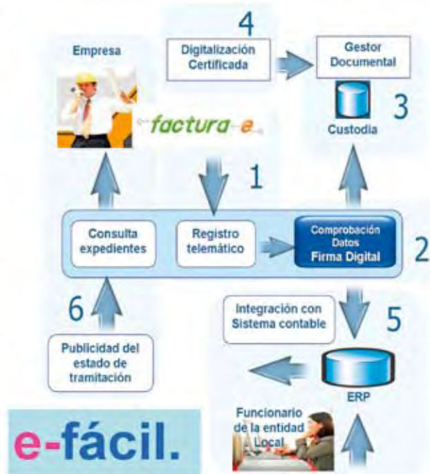
Esquema de e-fácil

la Sociedad de la Información en España, incluye en una de sus áreas de actuación los Servicios Públicos Digitales, y su extensión en el ámbito de las entidades locales: Avanza Local.