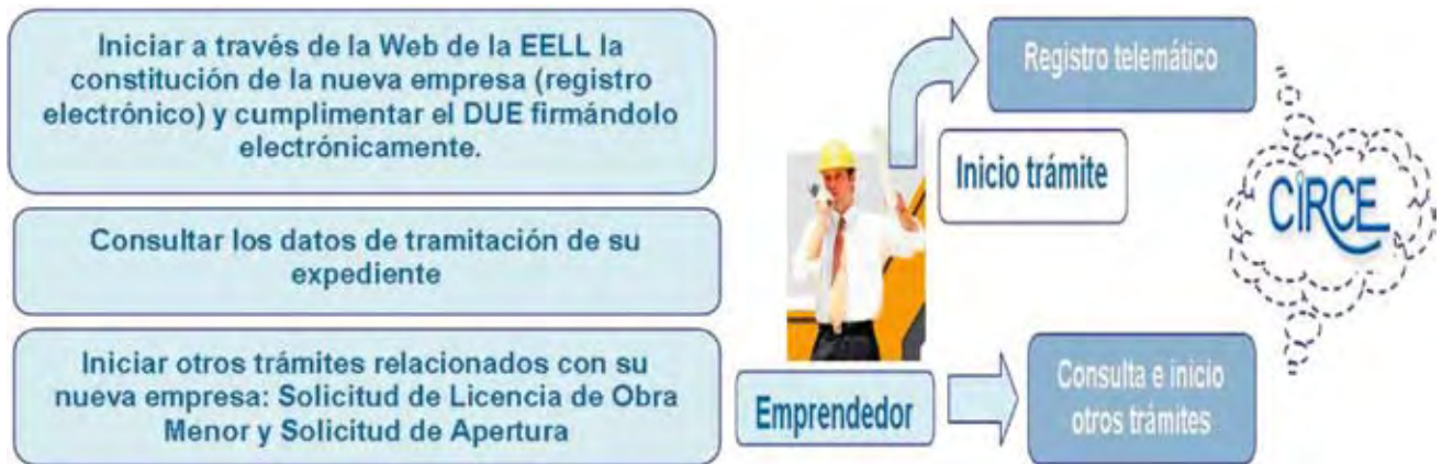
Esquema de CIRCE-Local