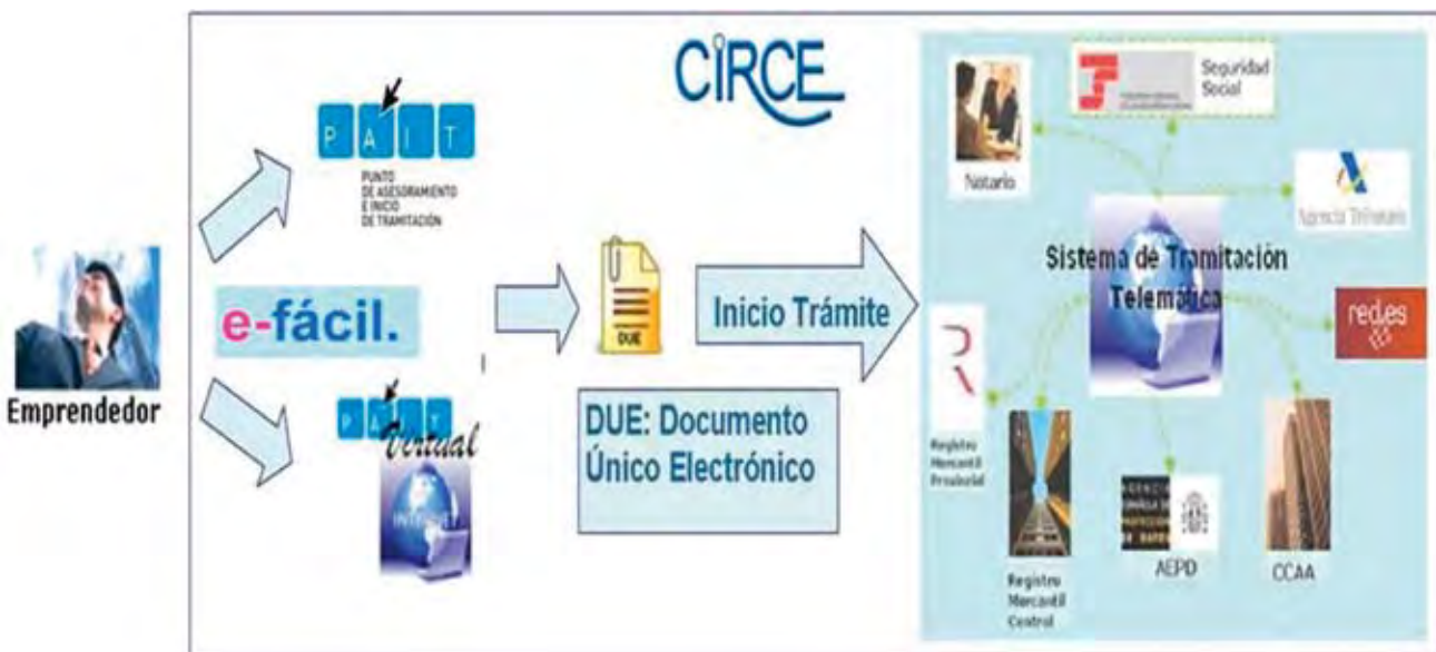
Esquema de CIRCE