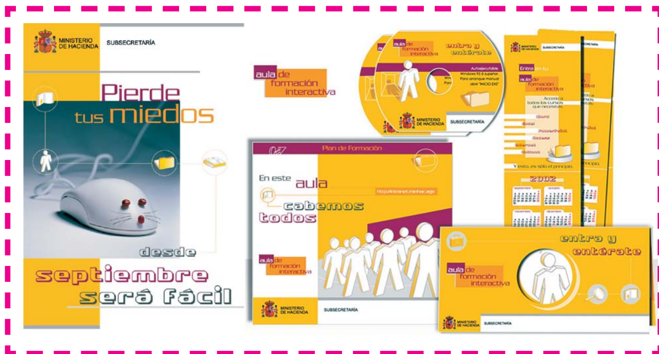
Material utilizado en la difusión del Programa

una ayuda para los gestores de las áreas de recursos humanos que se encuentran en numerosas ocasiones con dispersión tanto en los contenidos formativos como en los indicadores de resultados.