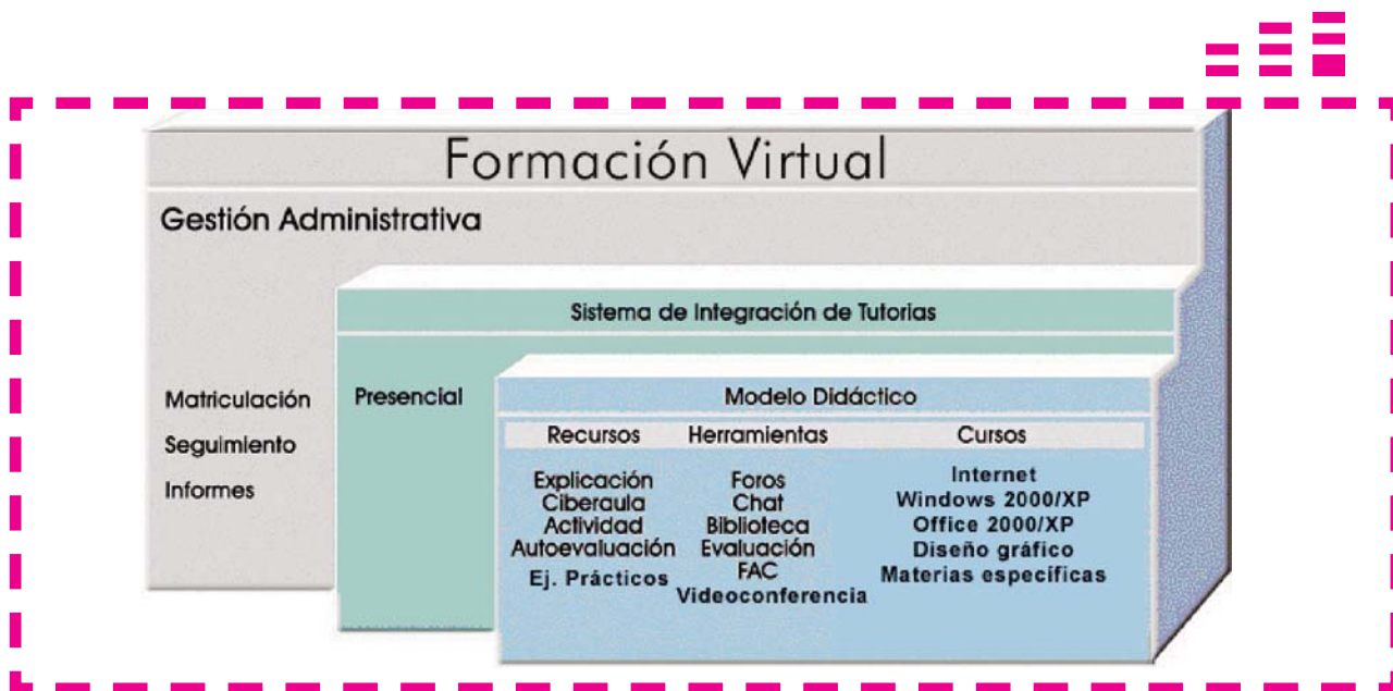
Esquema del Sistema integrado de formación virtual