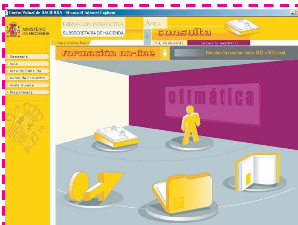
Página de entrada a la zona de formación