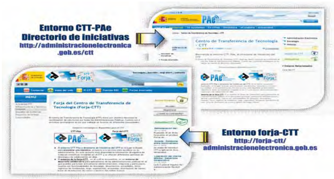
FIGURA 2. Como acceder

las administraciones públicas que accedan por la red SARA: