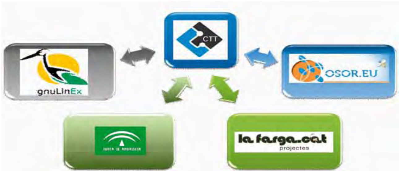
FIGURA 3. Federación de forjas