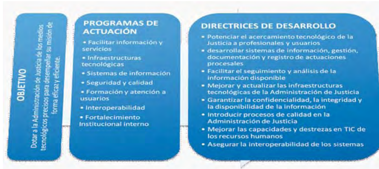
Figura 2. Desglose de políticas de modernización tecnológica de la Administración de Justicia

* Mejora de la gestión del almacenamiento de las piezas de convicción a través del sistema de identificación por radiofrecuencia .