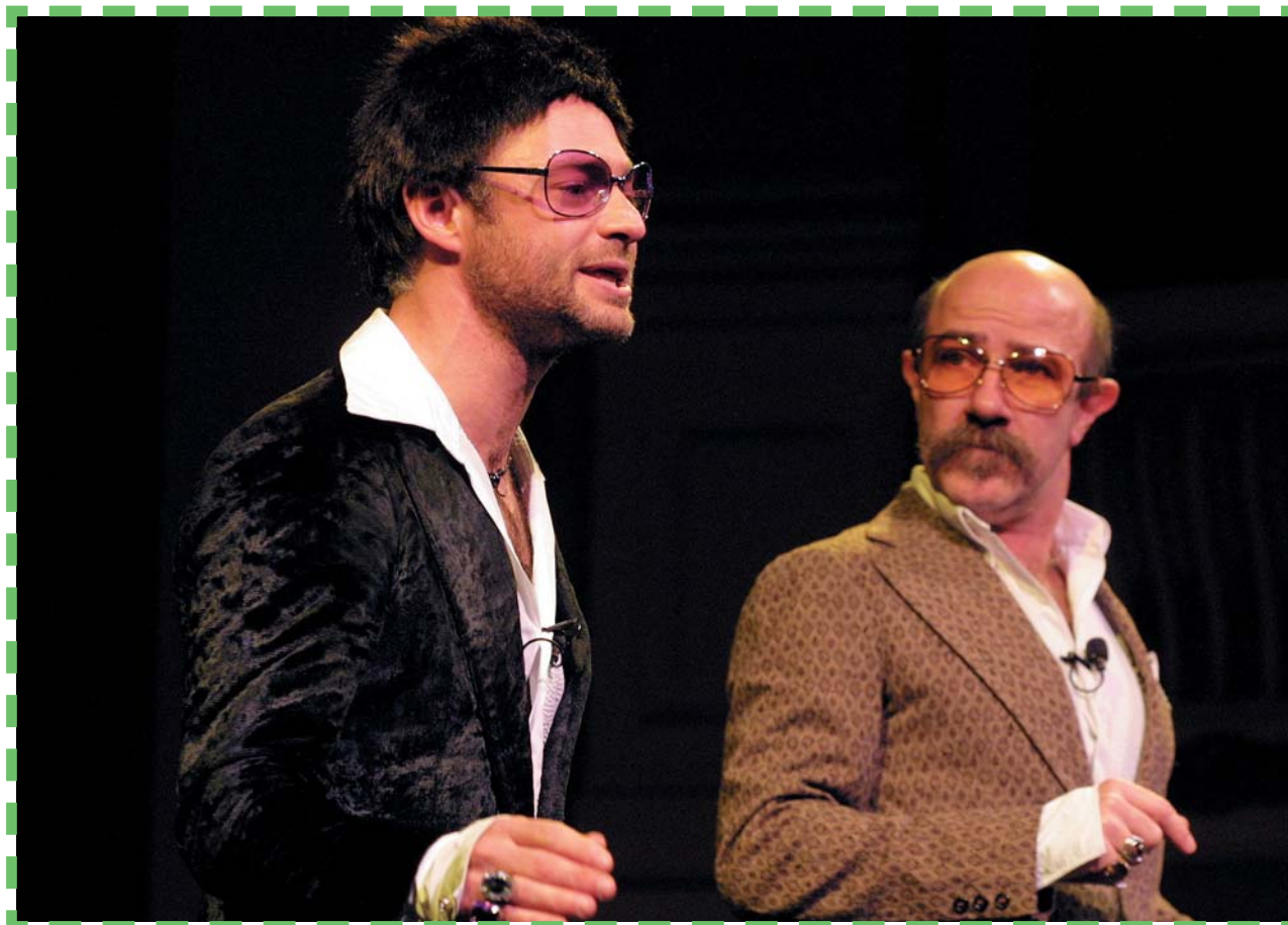
El grupo argentino "Los Modernos" representan en el Teatro Lara la obra "Breve desconcerto breve" en la que manejan el humor con buen gusto y un código propio