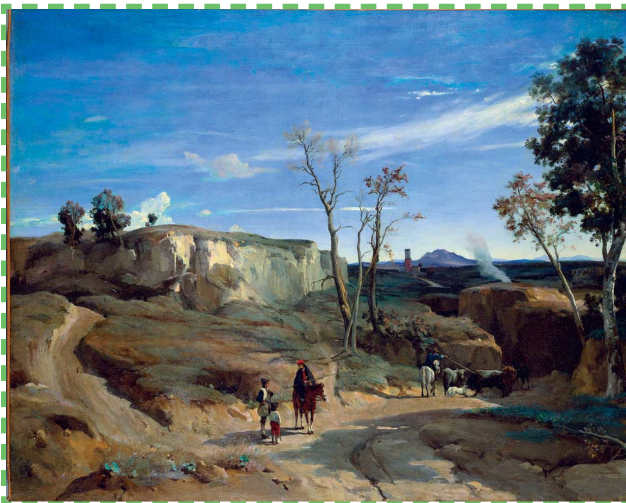
Corot nos demuestra en sus cuadros un gran dominio del color y de la luz