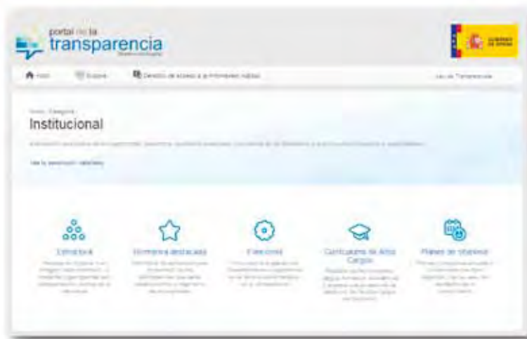
FIGURA 2. Detalle de la categoría “Institucional”