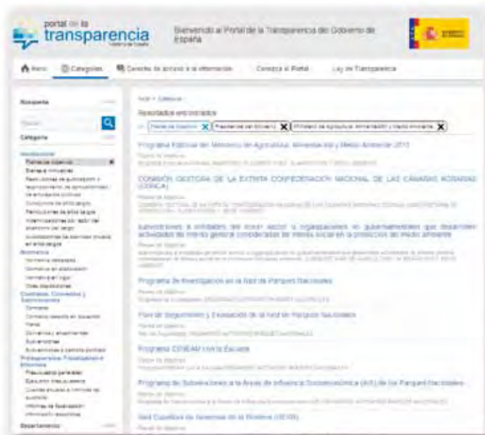
TABLA 4. Origen de la información del apartado “Economía”

La TABLA 1 muestra el origen de información de cada uno de los elementos. Cuando la fuente señala que el origen de información son los