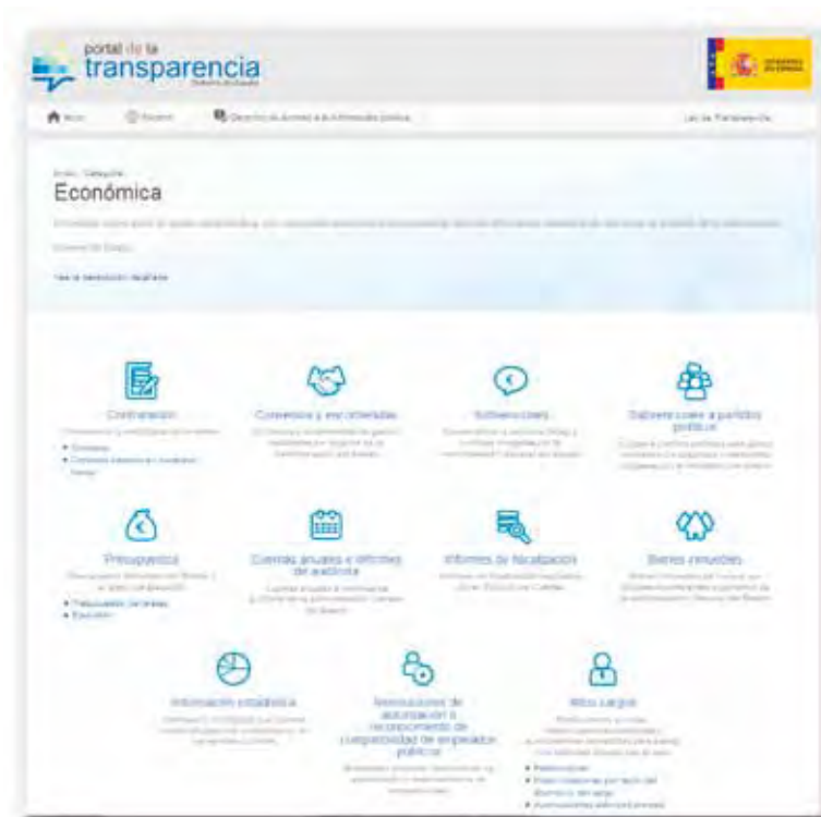
FIGURA 4. Detalle de la categoría “Economía”