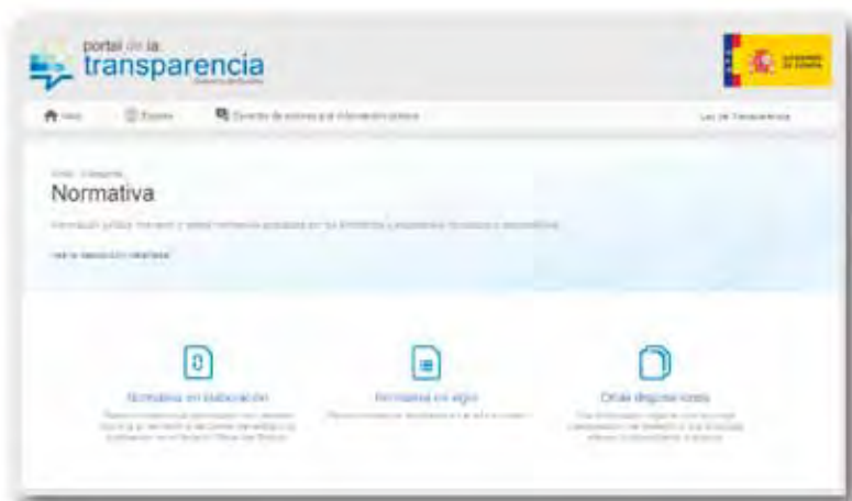
FIGURA 3. Detalle de la categoría “Normativa”

En la zona intermedia se ha situado el buscador de información. Es una herramienta potente que busca