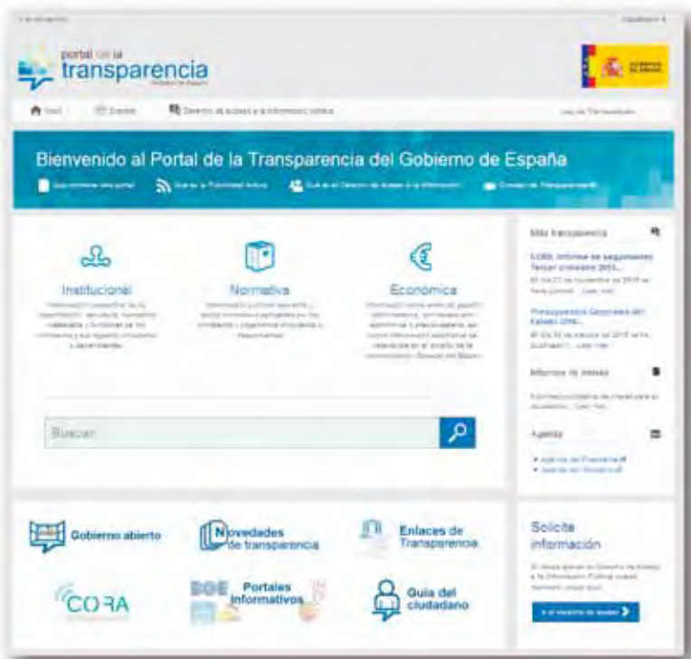
FIGURA 1. Página principal del Portal

Siguiendo con la publicidad activa, vimos que en los artículos 6, 7 y 8