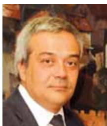
VICTOR CALVO-SOTELO Secretario de Estado de Telecomunicaciones y para la Sociedad de la Información

La Agenda Digital es la estrategia global para desarrollar la economía y la sociedad digital en España, identifica las principales líneas de actuación y establece los objetivos clave. Su desarrollo se realiza a través de planes específicos, de los cuales se han publicado los siete primeros. La Agenda Digital para España y su articulación a través de los planes específicos, permitirán un desarrollo más rápido y eficiente de la economía y sociedad digital en España, fortalecer las capacidades públicas y privadas y mejorar los resultados de las políticas públicas en el área TIC.