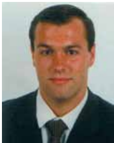
PABLO BURGOS Jefe de Área de la Subdirección General de TIC del Ministerio de Industria, Energía y Turismo

La situación económica actual nos conduce a priorizar en base a criterios objetivos a la hora de acometer proyectos y los intereses económicos y sociales se deben atender como criterios de decisión. Las TIC pueden aportar valor en la telematización de procedimientos administrativos motivados por nueva normativa mediante la mejora del funcionamiento interno y el ahorro de costes, tanto para ciudadanos y empresas, como para los propios organismos públicos.