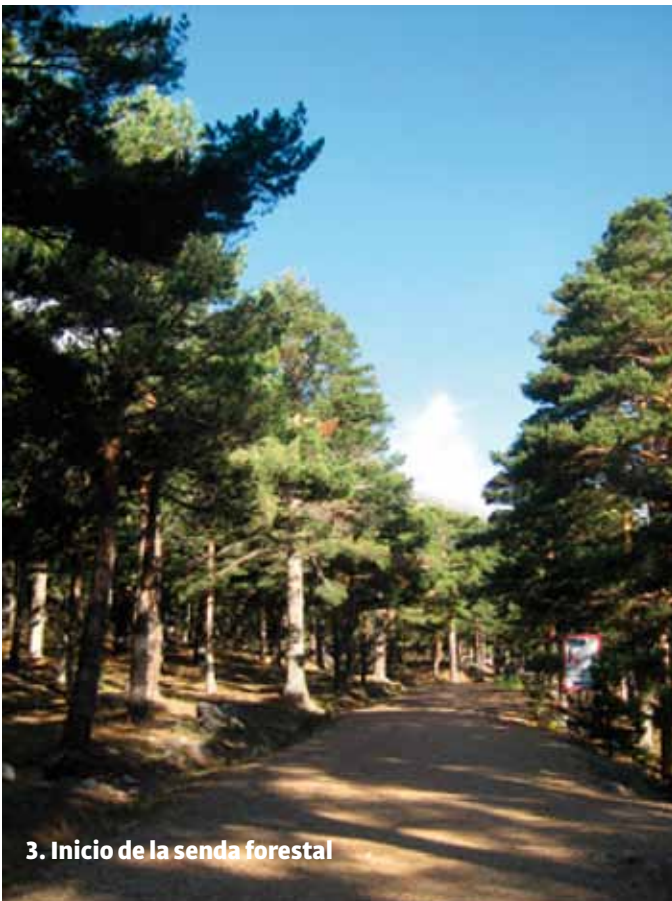
3. Inicio de la senda forestal

Por Colmenar Viejo: seguir sentido a Navacerrada (M-607), continuar hasta el Pueblo de Navacerrada, dejando atrás los desvíos de Cerceda, Moralzarzal y Becerril de la Sierra. Nada más llegar a una rotonda grande con una escultura de roca colgante, a la altura de Navacerrada, continuamos recto sentido Puerto de Navacerrada. Justo después, unos 400 mts y a la altura del km. 57, cogemos una pista asfaltada a mano derecha (curva muy cerrada), que nos conduce al Valle de la Barranca. 3 Km. después llegamos al final de la carretera y lugar donde podremos dejar el coche, en varios aparcamientos de tierra a nuestra derecha. »