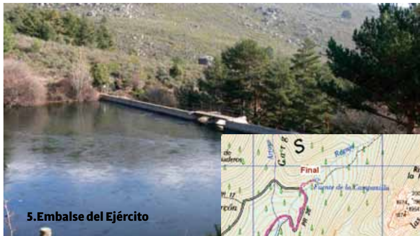
5. Embalse del Ejército

Por A6 Villalba: tomar dirección Navacerrada – Puerto de Navacerrada (M601). Continuamos por esta carretera hasta el km. 12, una vez pasado el pueblo de Navacerrada. Coger el desvío Cerceda - Colmenar Viejo a mano derecha y a 500 mts se ve el desvío a mano izquierda hacia el Valle de la Barranca. NO COGER EL DESVÍO ASÍ , pues resulta muy peligroso. Seguir unos 400 metros más adelante que hay una rotonda (la de la roca colgante), se hace el cambio de sentido y se vuelve por la misma carretera, cogiendo ya el desvío a mano derecha hacia el Valle de la Barranca (curva muy cerrada), que nos conduce al Valle de la Barranca. 3 Kms después llegamos al final de la carretera y lugar donde podremos dejar el coche, en varios aparcamientos de tierra a nuestra derecha. *