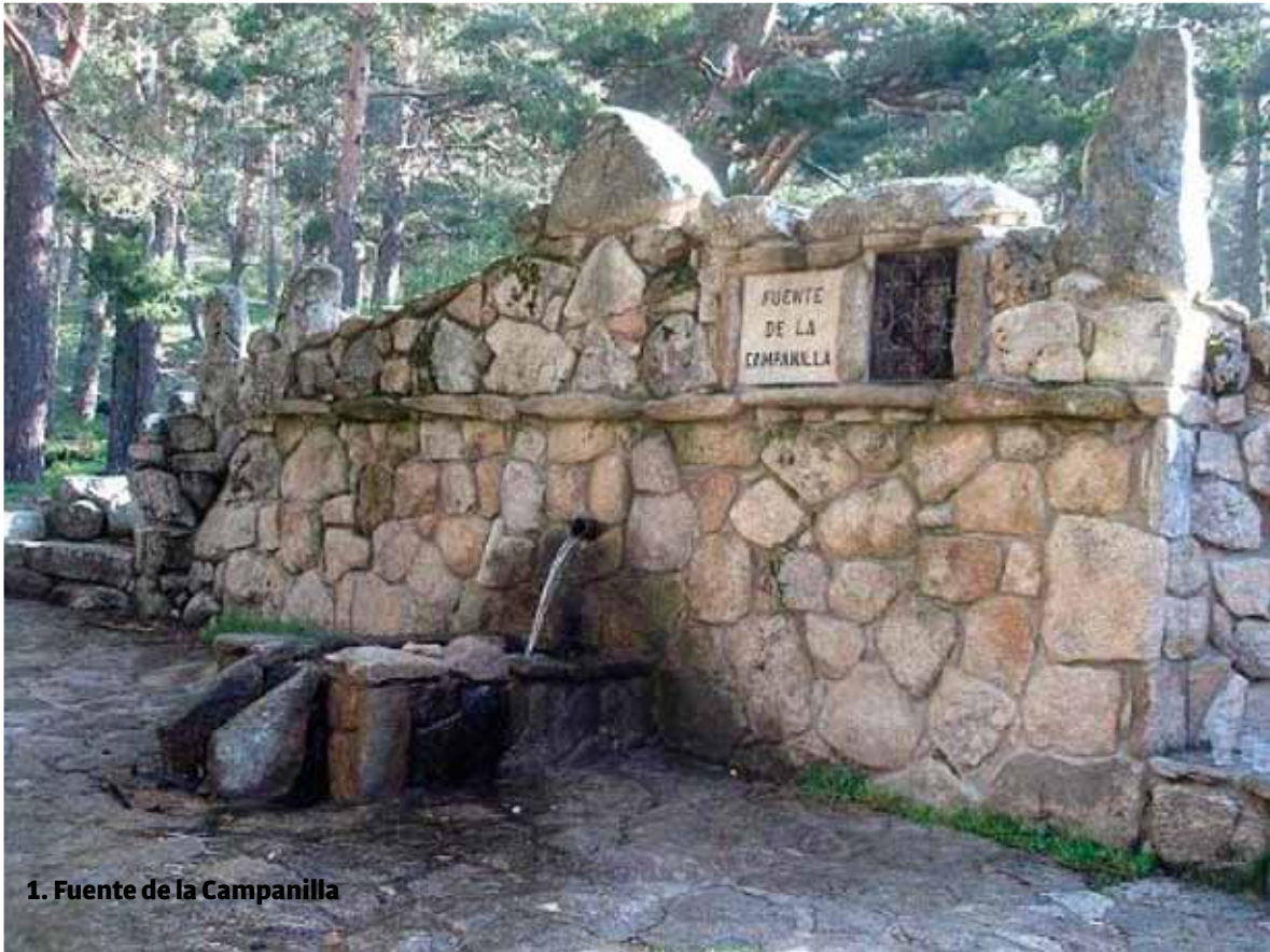
1. Fuente de la Campanilla

se encuentra un amplio aparcamiento de tierra, en varios niveles, a mano derecha según se sube. (Es conveniente no aparcar en el parking del hotel).