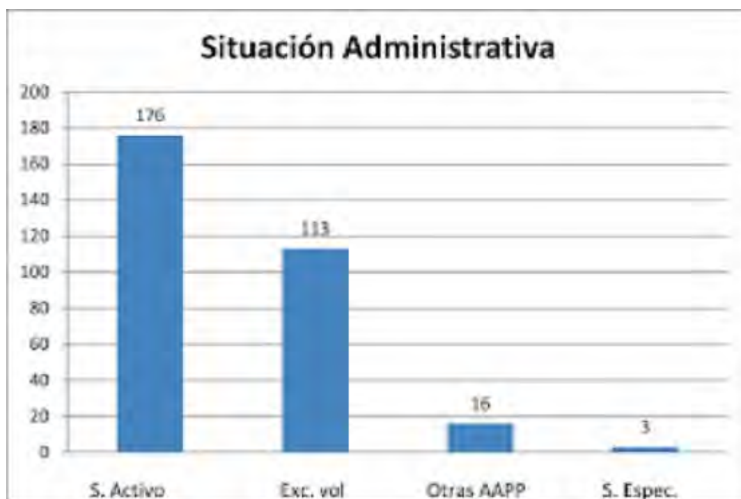
FIGURA 1. Situación administrativa