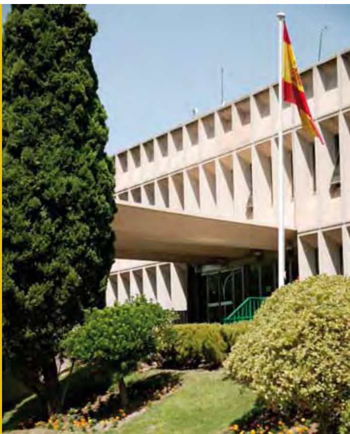
Sede actual de la Gerencia de Informática de la Seguridad Social