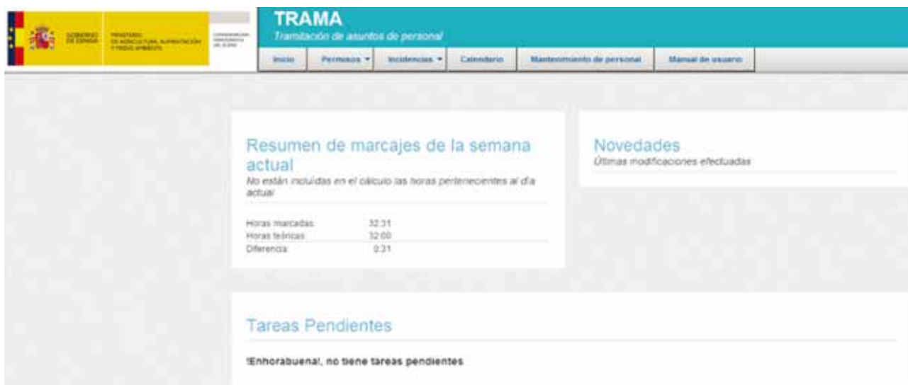
FIGURA 1. Aspecto de la pantalla de inicio

te, se llevaban a cabo las pertinentes validaciones de forma manual y se asentaban los permisos en los sistemas existentes (BADARAL, Control Horario). En un organismo como el nuestro, con gran dispersión geográfica (más de 50 centros de trabajo), dichos trámites podían llegar a dilatarse mucho en el tiempo. Al tener conocimiento de la existencia de TRAMA, enseguida apreciamos que, junto a una alta eficiencia, proporcionaba avances de gran interés: