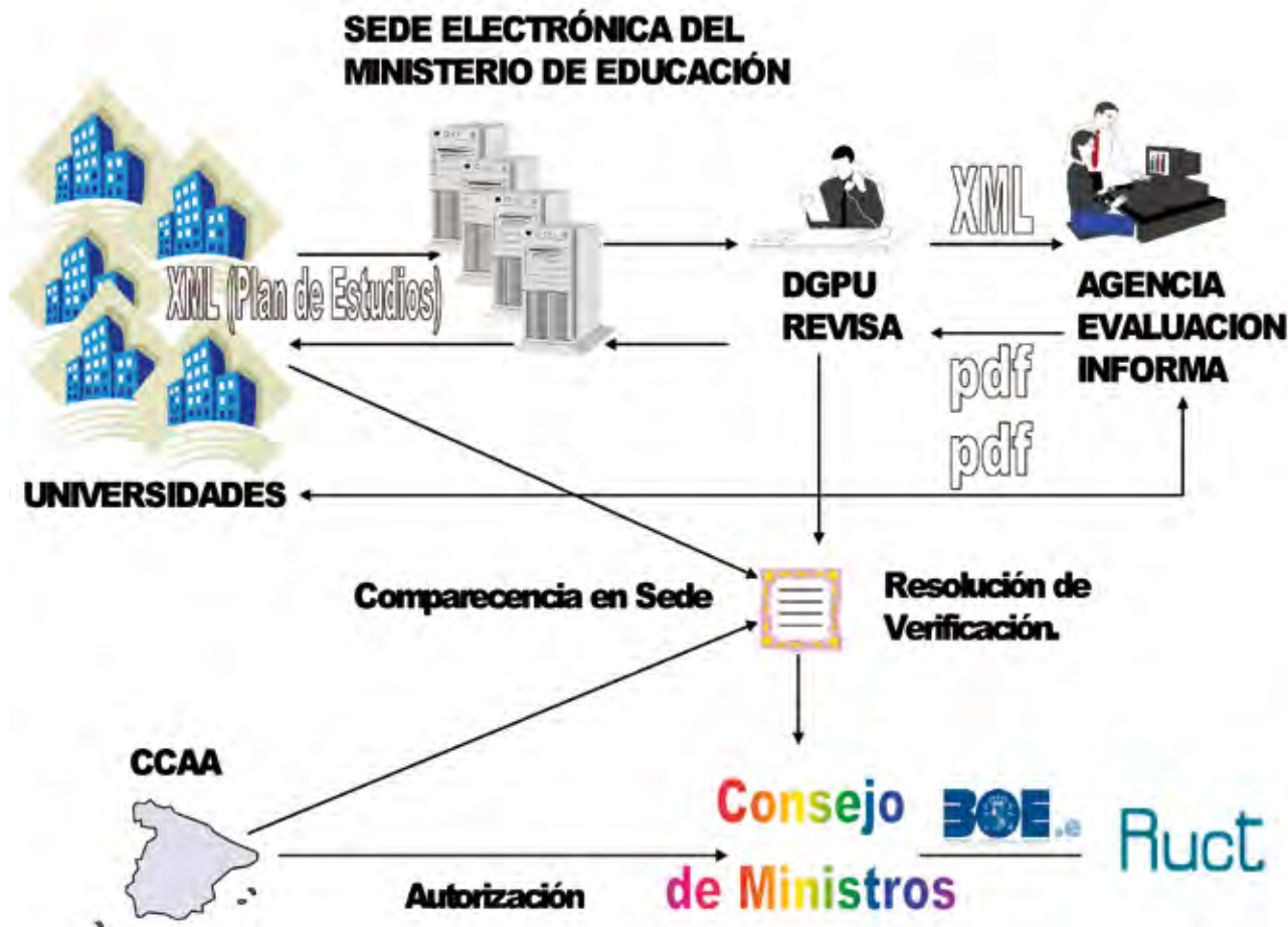
FIGURA 1. Esquema del modelo colaborativo

a la que pertenece y enviar mediante el registro electrónico del Ministerio de Educación el fichero XML correspondiente. Si éste es introducido de manera previa, como representante legal de la Universidad en el XML a enviar, o de forma alternativa, proceder a la impresión desde el servidor del Ministerio. Esta vez, con el CSV y sin marca de aguas, para presentarlo de forma manuscrita en papel por un registro presencial, cumpliendo así con el Principio de Igualdad pro-