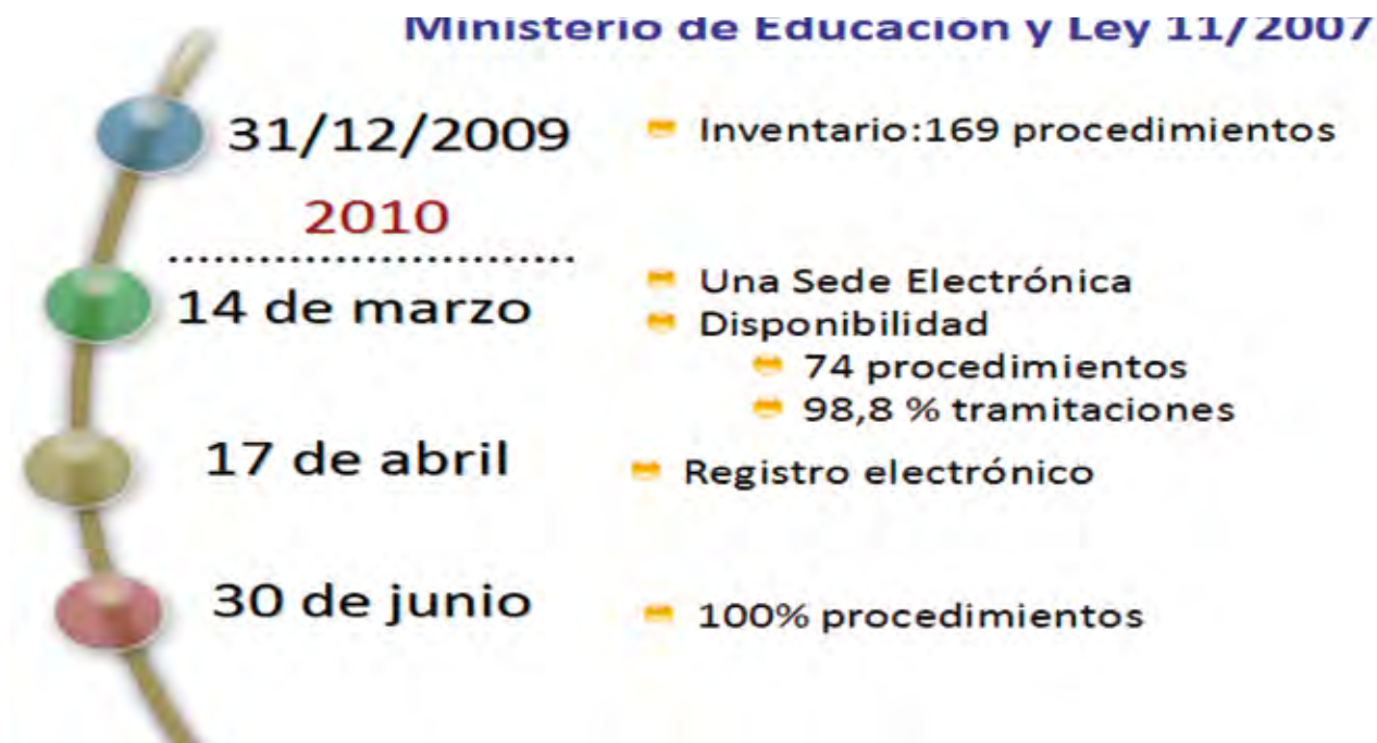
FIGURA 3. Principales hitos y fechas