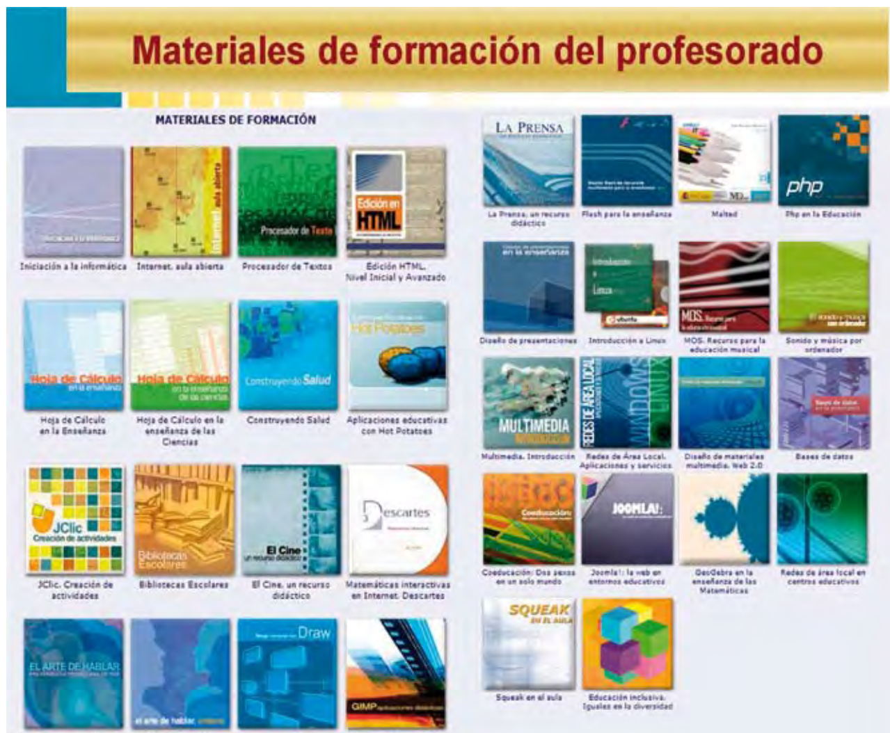
FIGURA 2. Material didáctico a disposición del profesorado

todas las etapas educativas y en todas las áreas del currículo.