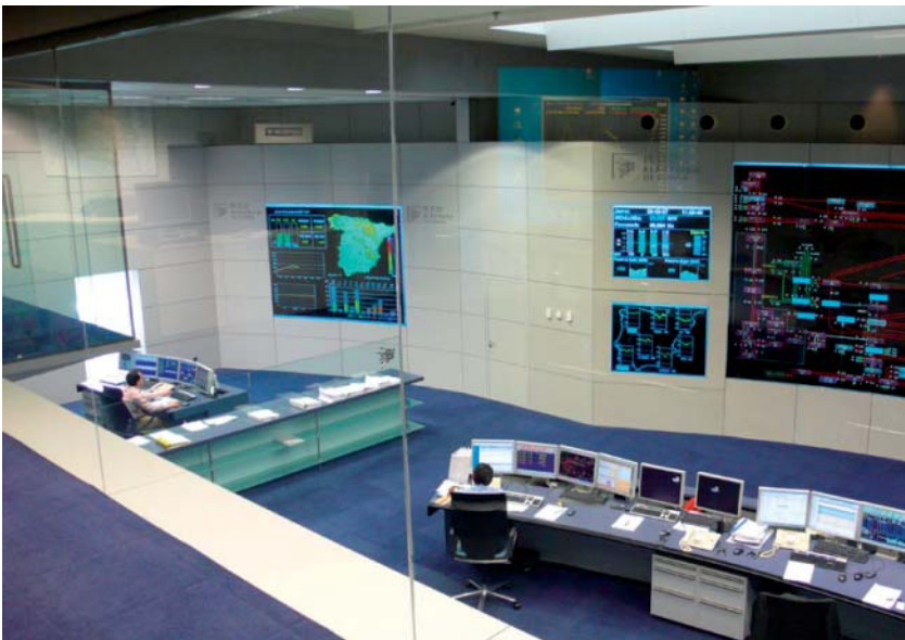
Puesto de mando del Centro de Control

lisis de sistemas de potencia y otros desarrollados específicamente (GE-MAS-Generación Eólica Máxima Admisible en el Sistema) el CECRE calcula la producción eólica que en cada momento puede integrarse en el sistema eléctrico en función de las características de los generadores y del estado del propio sistema eléctrico.