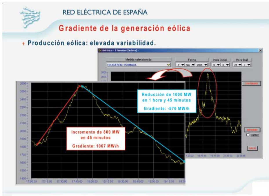
GRÁFICO 1. Evolución de la potencia eólica instalada en España (datos a final de año)