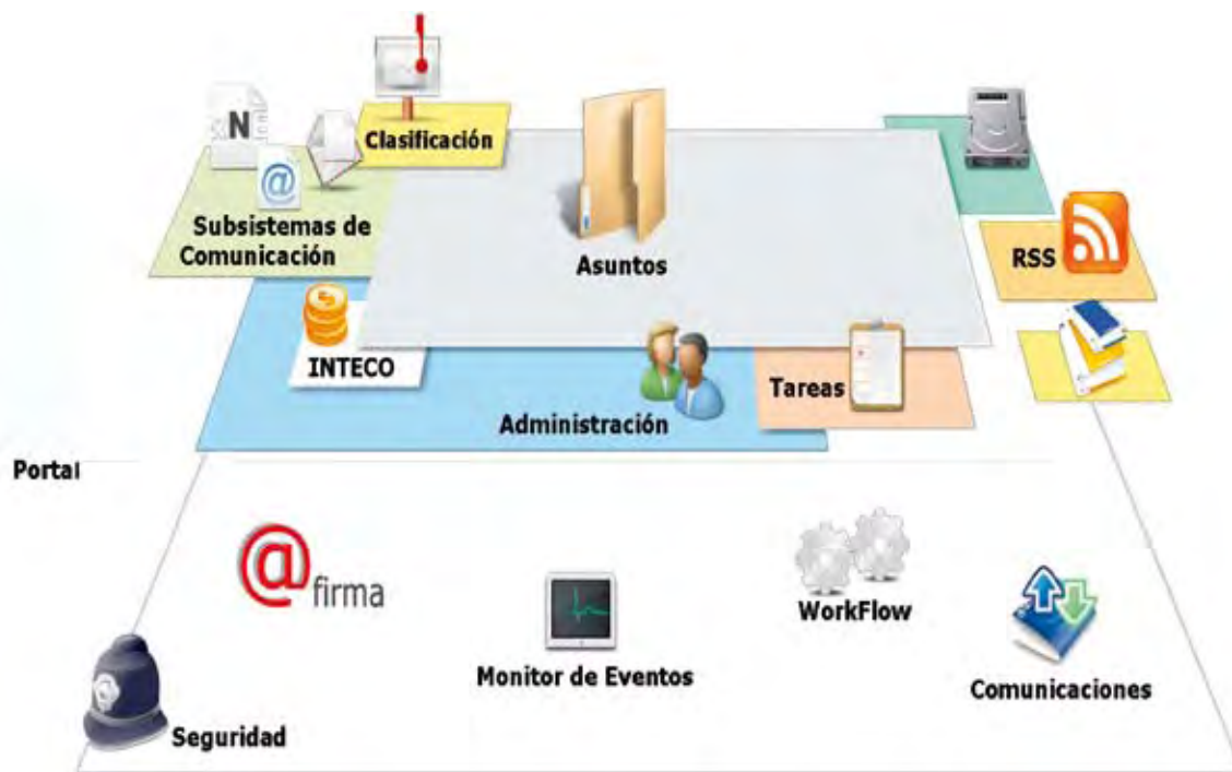
FIGURA 1. Esquema de los diferentes subsistemas

eficaces. Este Manual de Procedimientos constituye, por otra parte, el documento de especificaciones funcionales que debe cumplir la aplicación informática de las Abogacías. La elaboración de este Manual cumple básicamente dos objetivos: