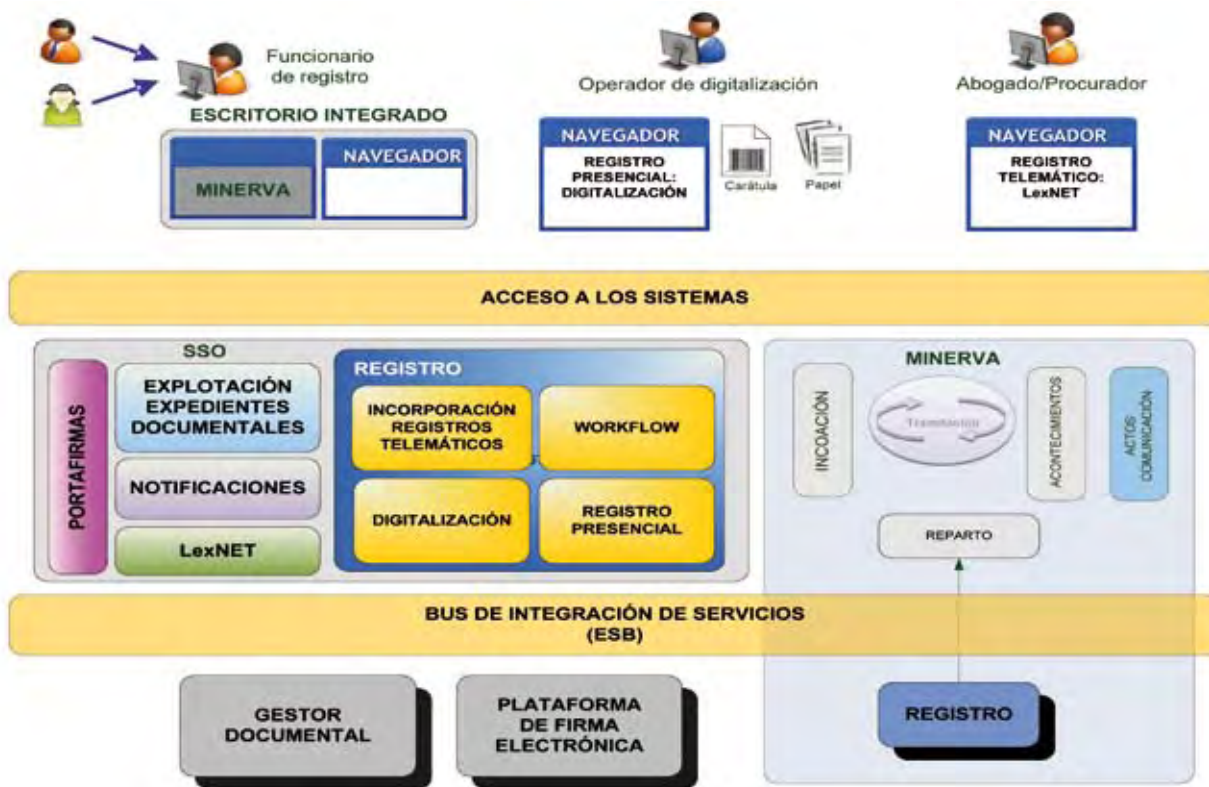
FIGURA 2. Arquitectura lógica

de gestión procesal basados en una gestión digital integral del expediente judicial, que permitirán agilizar la tramitación y facilitar el acceso a la información, a corto plazo y a largo plazo permitirá una refactorización de los procedimientos, permitiendo una simplificación y racionalización administrativa en el ámbito de la Justicia, así como una reestructuración orgánica de los órganos judiciales en consonancia con la modernización que supone la Nueva Oficia Judicial.