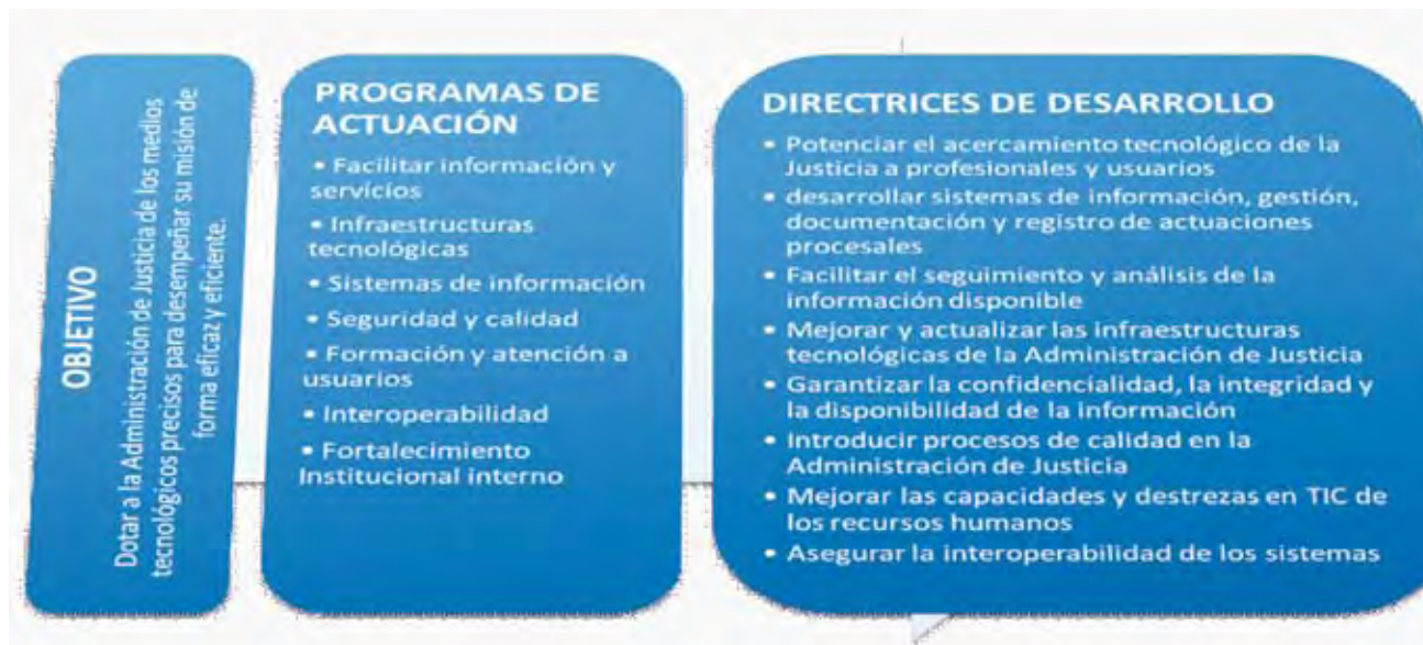
Figura 2. Desglose de políticas de modernización tecnológica de la Administración de Justicia

* Mejora de la gestión del almacenamiento de las piezas de convicción a través del sistema de identificación por radiofrecuencia .