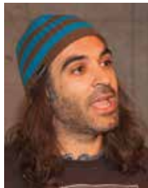
CHEMA ALONSO @chemaalonso Chief Data Officer en Telefónica. Hacker y experto en informática.

Hay muchas diferencias entre lo que hacéis vosotros en la Administración Pública y lo que yo hago en el sector privado. Mientras que en la Administración existe una perspectiva más enfocada a la gestión, en mi caso me dedico gran parte del tiempo a la innovación. Sin embargo, en mi ponencia voy a hablar sobre qué es lo que yo valoro como cualidades muy importantes de las personas que están trabajando conmigo en el equipo, día a día, que creo que es de utilidad en ambos sectores.