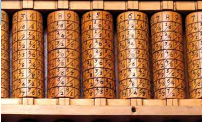
FIGURA 6. Rodillos de una máquina similar a la de Gaspar Schott

cuando veas como transporta lo que se lleva de las decenas o centenas o como lo descuenta en las sustracciones...”.