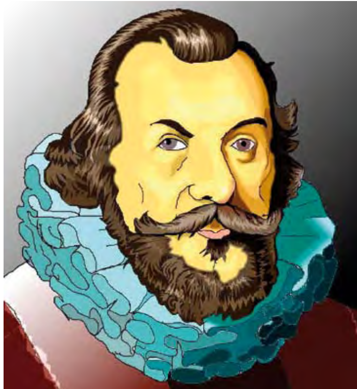
FIGURA 1. Wilhelm Schickard (dibujo del autor)

Basándose en el procedimiento de cálculo de Neper, publicado en 1617, en su libro sobre la “Rabdologiae”, donde se describían las reglas de uso para multiplicar con sus tablillas, o varillas, a las que ya nos referimos en el anterior fascículo de nuestra Historia de la Informática (capítulo 12), se han construido multitud de máquinas con elementos similares. La primera de todas, inspirada en estas ideas, fue diseñada en 1623, seis años después de la publicación de la “Rabdología Neperiana”. La diseñó un alemán, profesor de la Universidad de Tubinga llamado Wilhelm Schickard, (1592 - 1635) (figura 1). Schickard denominó a su mecanismo: “reloj de cálculo”, tal vez por su posible »