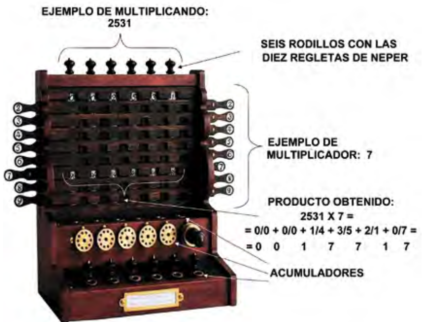
FIGURA 4. Máquina de Schickard

Balzac recoge los detalles de ambas cartas, que procedemos a reproducir. En la del 20 de septiembre del año 1623 Schickard le dice a Kepler: “Lo que haces tú con el cálculo manual, lo he intentado yo hace poco pero mecánicamente... ..He construido una máquina que cuenta inmediata y automáticamente los números dados, suma, multiplica y divide... ..Estoy seguro que vas a estallar de alegría, »