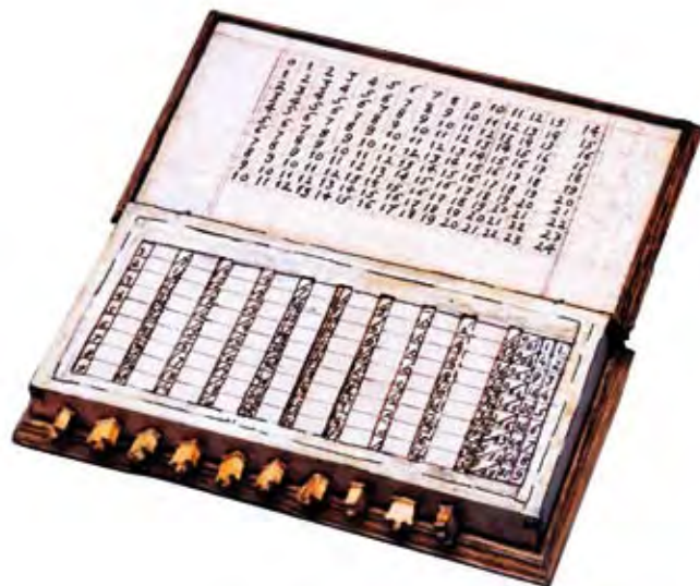
FIGURA 5. Máquina de calcular de Gaspar Schott