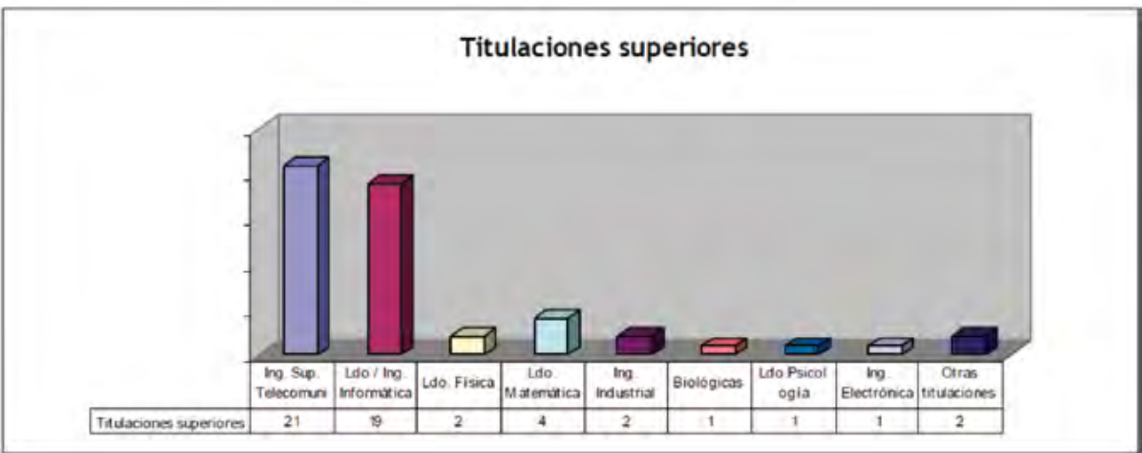
FIGURA 1. Diferentes datos estadísticos de la Promoción

Los miembros de esta promoción XVI disponíamos, casi en la totalidad, de experiencia profesional en el sector privado, tal como se muestra en la Figura 1, destacando áreas de actuación tales como la gestión de proyectos TIC, el desarrollo de aplicaciones, las comunicaciones y la explotación de sistemas. Además, un número representa-